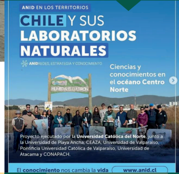
El conocimiento nos cambia la vida www.anid.cl

Dentro del Encuentro territorial “Chile y sus Laboratorios Naturales”, ANID junto a otros actores realizó una visita guiada al humedal El Culebrón para conocer su valor como laboratorio natural y los diversos desafíos que enfrenta. ANID fue guiado por profesionales de CEAZA junto a los monitores ambientales de CONAF.